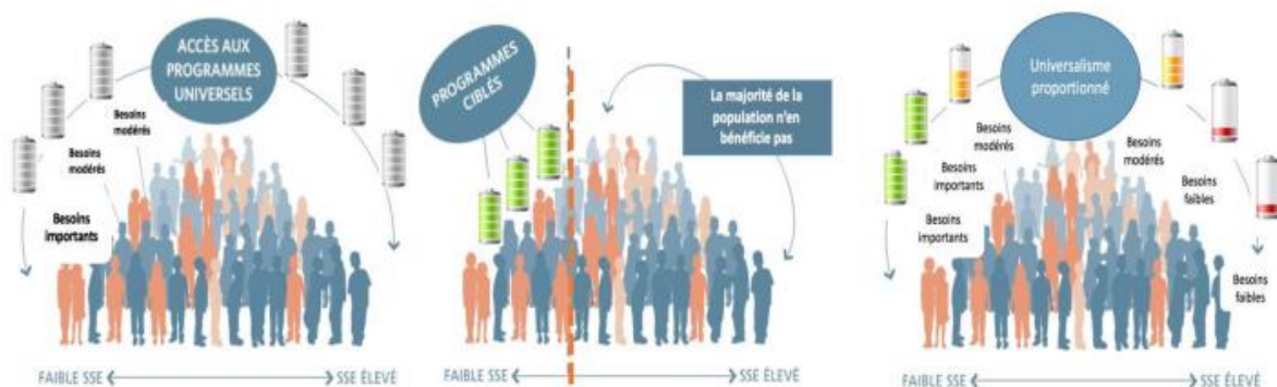
Human Early Learning Partnership, Université de la Colombie Britannique, 2011

Het evenredig universalisme plaatst universele initiatieven in de steigers met het oog op het welzijn van allen, met een evenredige intensiteit voor behoeften en hindernissen. Het doel is om initiatieven toegankelijker te maken voor de mensen die er de grootste behoefte aan hebben.